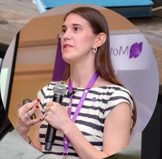
Por: Denise Dajles Kellermann Ingeniera